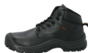
Suela PU doble densidad