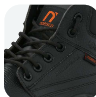
Capellada 90% CUERO 10% PU